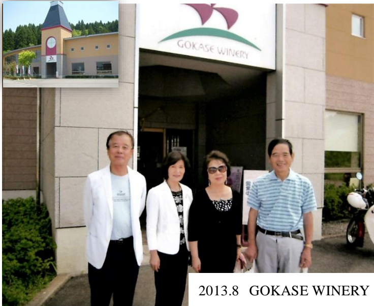
2013.8 GOKASE WINERY