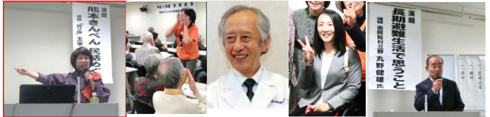
笑顔を作ってくれた講師の方々