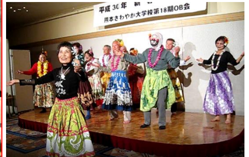
平成30年 期 熊本さわやか大学校第18期OB会