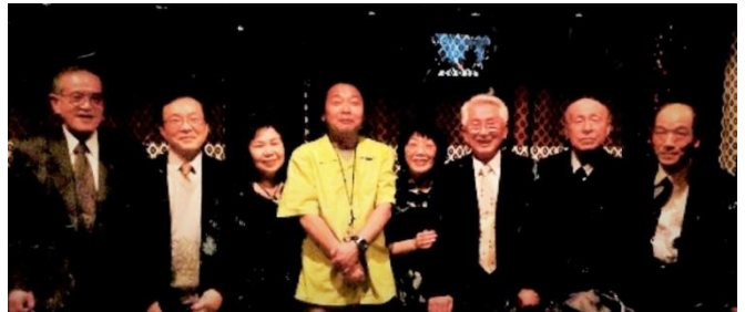
パートナーシップ講演会を終えて 2014.1

当時 72 歳、第 1 回熊本城マラソンをきっかけに ホノルルマラソン、福岡マラソンや各地の大会に出場 し、完走することができました。 今年、傘寿となりますが毎朝 10 キロのスロージョギ ングを続け、体力が続くかぎり、大好きなマラソンに 挑戦したいとおもいます。 いつまでできるかな～。応援よろしくお祈いします。