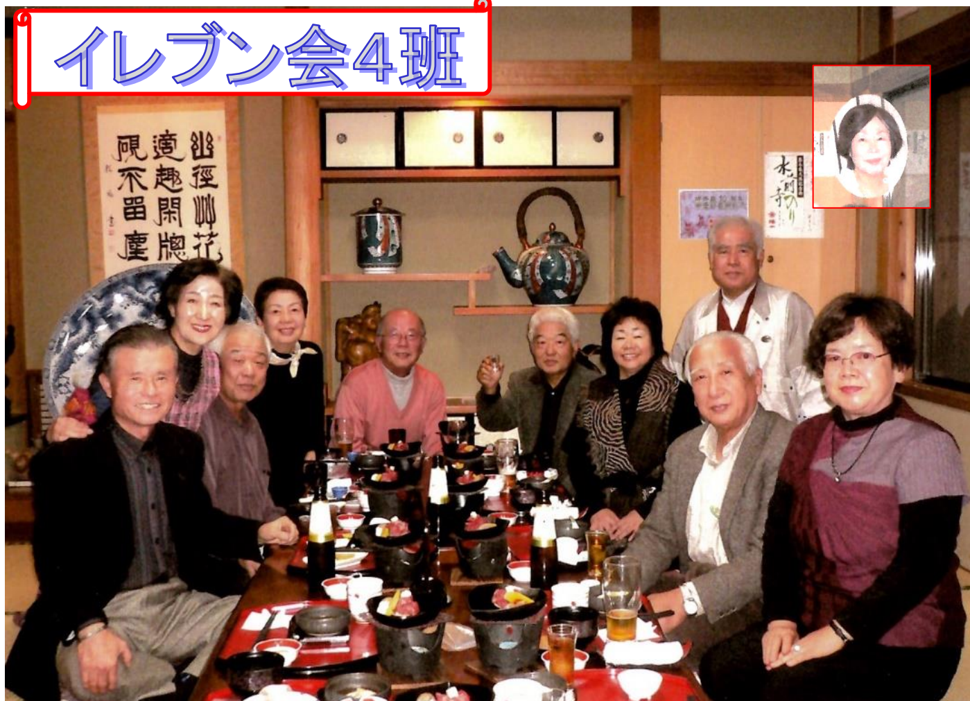
イレブン会 忘年会 2012.12