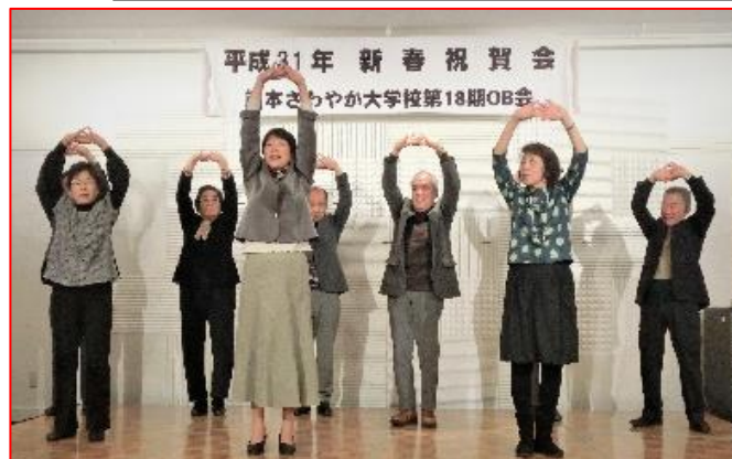
2019.1 新年会いなぎ会合同 伸びた君です。