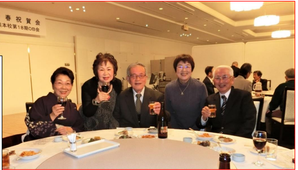
おはこ会を支えている顔ぶれです

平成30年度旧2、3、9班を統合して、新しい2班として出発した。しかし新班は、結成後まだ日も浅い。旧各班の歴史が長く、思い出も多い。今回は旧各班よりの報告及び班員の個別投稿という形を取らせて頂く。