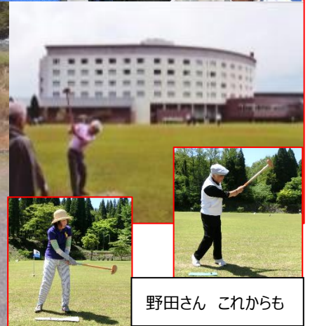
野田さん これからも