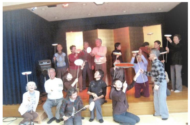
175会 懇親会 2010.10