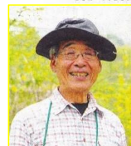
森林インストラクター 熊日情報誌「あれんじ」掲載