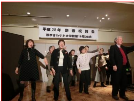
平成28年 新春祝賀会 熊本さわやか大学校第18期OB会