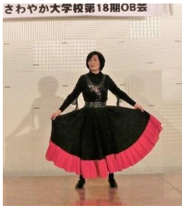
さわやか大学校第18期OB会