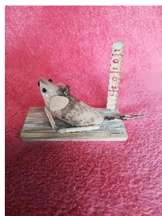
今年で 10 年目、 丑年（うし）、寅年（とら）で 12 干支完了！