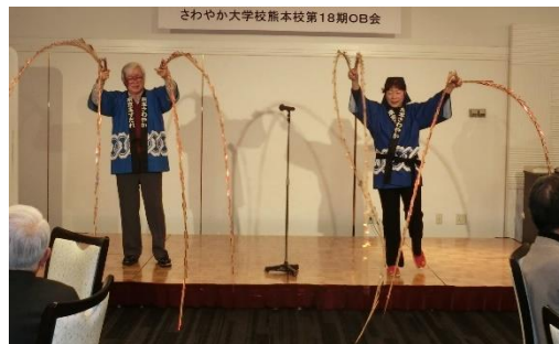
さわやか大学校熊本校第18期OB会