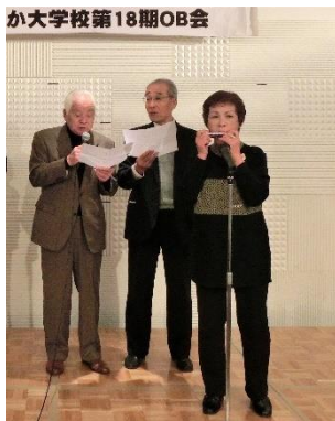
さわやか大学校第18期OB会