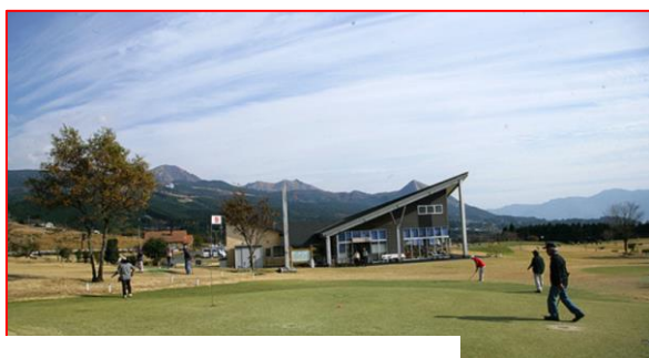
毎月の長陽パークゴルフ場にて