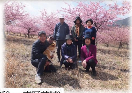
(2019年3月の阿蘇たかな漬体験 in 南阿蘇村)