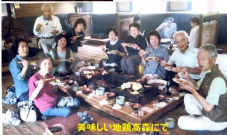
美味しい地鶏高森にて