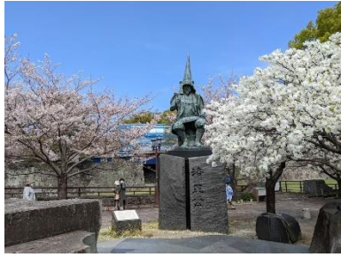
【加藤清正公像と桜】