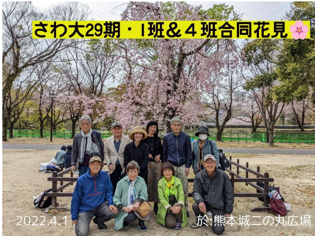
【桜の下で集合写真】※2名欠席。