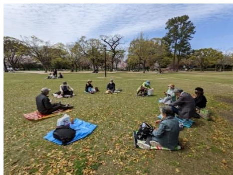
【蜜を避け、間隔を空けて座っています。】