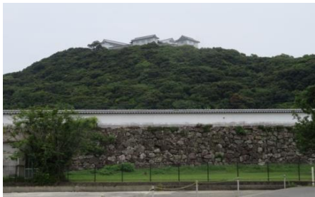
復元された 富岡城