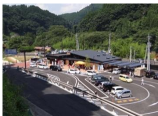
道の駅慈恩の滝くす

「高塚愛宕地蔵尊」は、地蔵菩薩を本尊としながら鳥居があり、鐘とともに鈴がさがっており、さらに境内には天照大神の摂社があるなど神仏混滞の信仰形態を残しており、年間200万人を越す参拝客が訪れます。お地蔵さんが約2000体もあります。