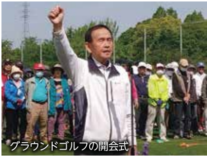
グラウンドゴルフの開会式