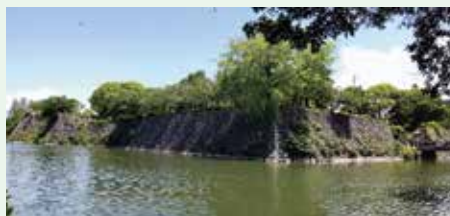
当時の面影を残す松江城跡の石垣「古麓城」と「麦島城」は現存せず、跡地に看板が立てられています

2代目八代城である「麦島城」は戦国時代に小西行長によって築かれた城です。1600