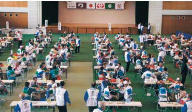
ねんりんピック2011（ふれ愛）熊本において、健康マージャンは熊本市南区の富合雁回館で開催。70卓を使った競技は熱く繰り広げられた。

けない・お酒を飲まない・タバコを吸わない・誰でも参加できる・短時間で終わるといふ、健康マージャンに似た5つのルールでした。「すぐに人が集まって大会ができると思っていたのですが、ダーティなイメージがあるためか全く人が集まりませんでした」。そんな中、広報依頼に訪れた熊本市役所で、初めて健康マージャンについて知ることになりました。市の担当者から「今後競技人口が増えるだろうから、教室を開いてほしい」と提案されたことをきっかけに、健康マージャンのフアンを育てていこうと、活動を共にしてきた奥さまを含む4人が一期生と