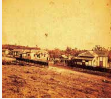
初期の回春病院の風景

デルは、その苦しみを減じるために何が出来るだろうかと考えました。そして、「日本は、彼らの苦痛と絶望の二重苦を救うために何もしていない。彼等は、家族や親せきのために、故郷をはなれ、流浪して、長いこと苦しみ、とむらうものもなく死んでしまう。この難病のために、何か治療の方法でも