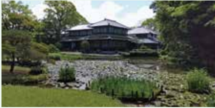
四季折々に花が咲く美しい「松浜軒」の庭園 5月下旬～6月上旬に咲く肥後花菖蒲が有名です。

室内には、茶道をこよなく愛した松井家に代々伝わる茶道具や書画が展示されており、特に3月に展示される江戸時代の雛人形は有名です。