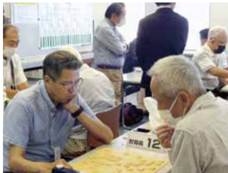
大会（将棋の部）の様子