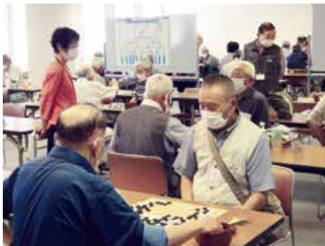
大会（碁碁の部）の様子

来年度は健康マージャンが文化交流大会の種目としてエントリーされます。これからますます進化する「熊本ねんりんピック」に乞うご期待です。