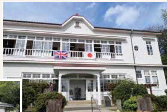
リデル、ライト両女史記念館元研究所と納骨堂