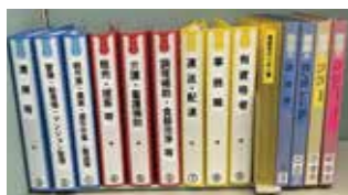
職種ごとに整理された求人票のファイル

求人票は紙で見ることができるので、パソコンを使って検索するのが難しい人でも安心してご利用いただけます。