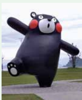
くまモンポート八代では巨大なくまモンがお出迎えしてくれます。

八代平野を流れる球磨川は富士川と最上川と共に日本三急流の一つで、川の水は、農業用水や工業用水、水力発電などに利用されています。八代地域の発展に無くてはならない球磨川ですが、「令和2年の豪雨水害」では大きな被害が発生しました。被災した球磨川沿いの国道219と八代と人吉間の肥薩線は復旧には未だ時間がかかりそうで、八代駅から葉木駅間はタクシー輸送を行っています。