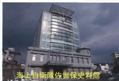
海上自衛隊佐世保史料館