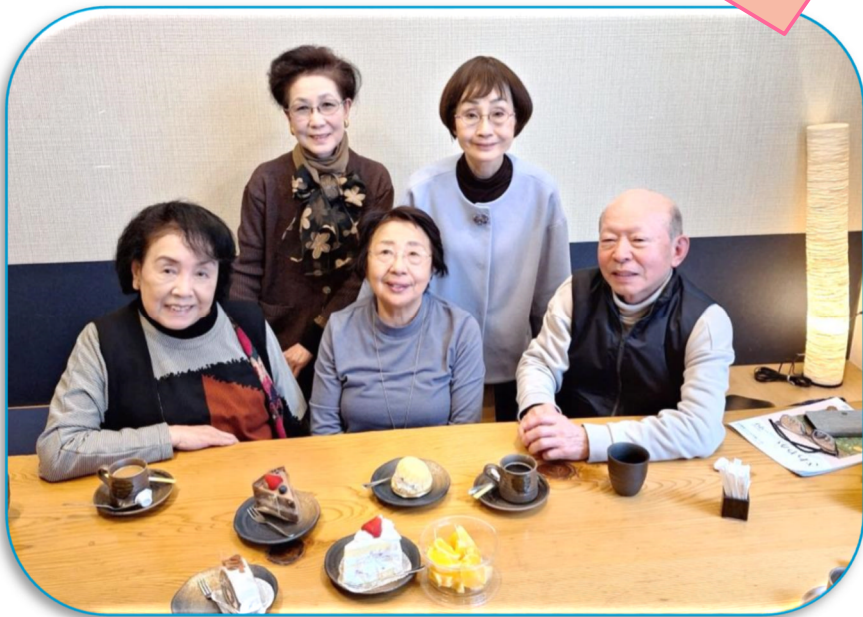
8班、2月29日お誕生会「八潮」