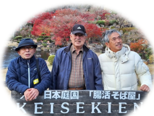
男子会、11月24日「耶馬溪」

旅クラブ、11月27, 28, 29日「いにしへの奈良大和四寺巡礼と世界遺産を訪れる旅」