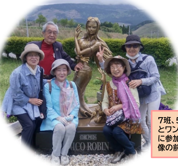
7班、5月5日「熊本地震遺構 とワンピース像を巡るツアー」 に参加、ウソップ像とロビン 像の前で