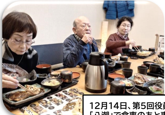
12月14日、第5回役員・理事会 「八潮」で食事のあと事務打ち合わせ