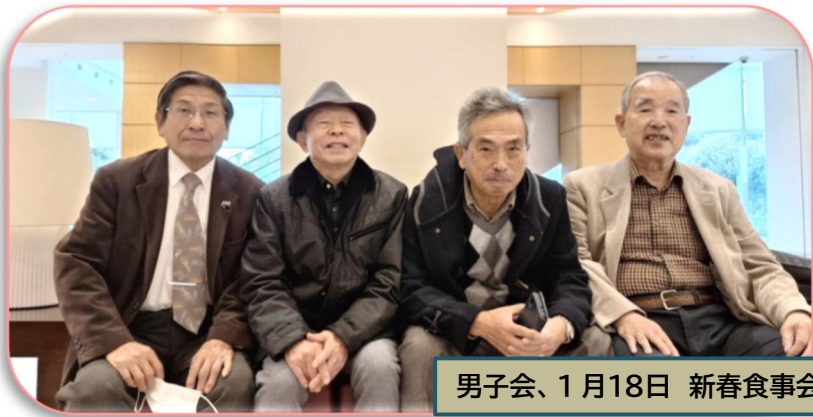
男子会、1月18日 新春食事会