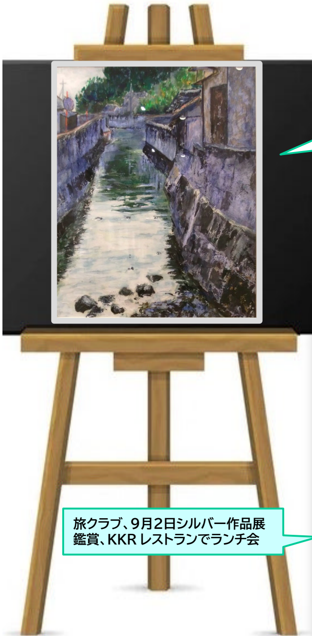
シルバー作品展 展【佳作】 7班、勝屋美夜子 「松合の汽水域」(洋画)