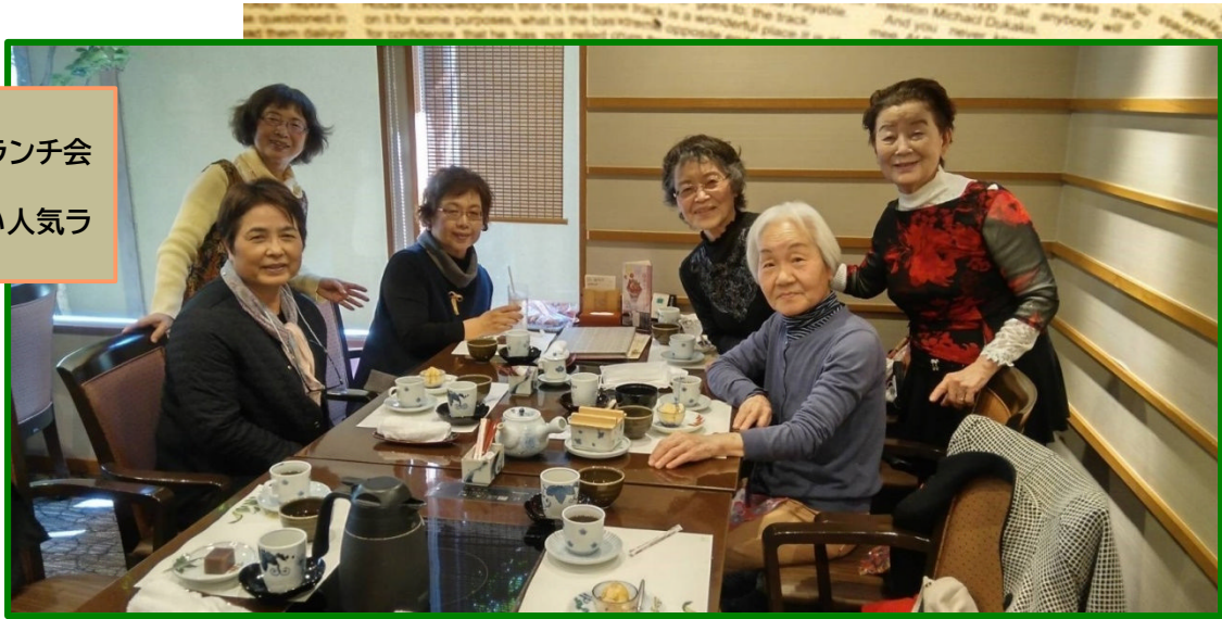
7班、3月2日 新旧理事交代ランチ会 「梅の花」 予約が取れない人気ラ ンチでした