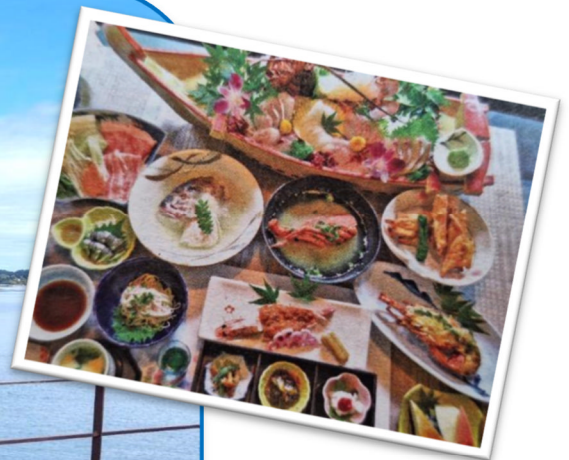
8班、9月26日「天草伊勢 エビグルメツアー」