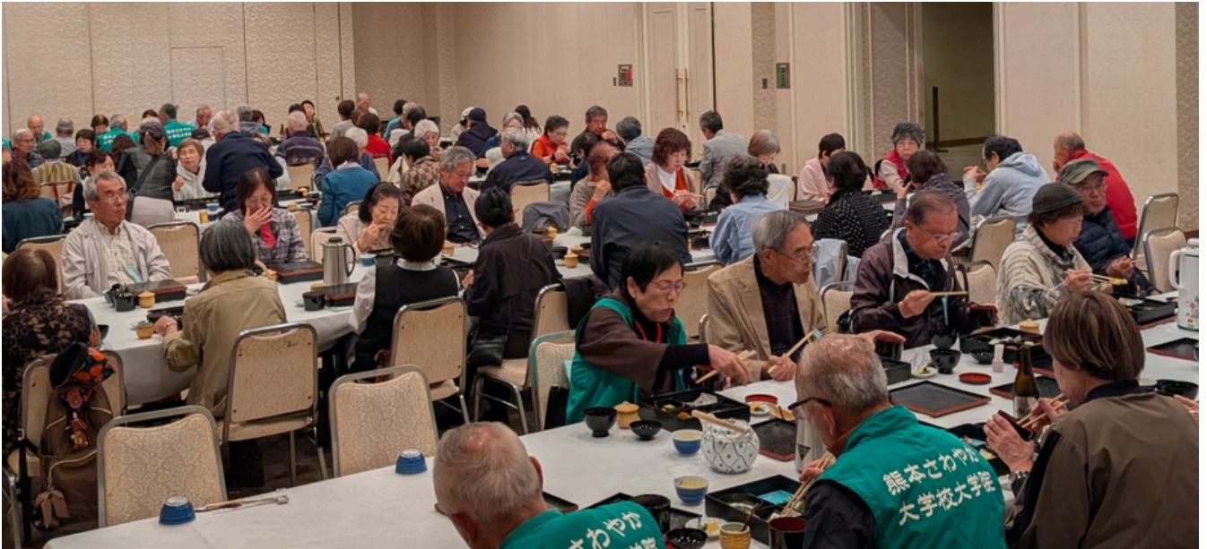
城彩苑→道の駅大津→竹田市歴史文化館・瀧廉太郎記念館→昼食 (岩城屋)→朝倉文夫記念館→道の駅すごう→道の駅大津→市民会館前